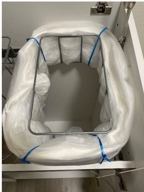
Säkkikasetti asennettuna telineeseen